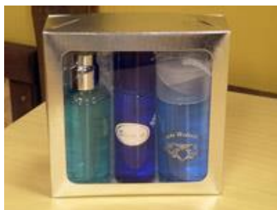
Água Facial – Após Barba