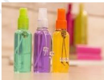
Body Splash (Colônia)

Dissolver em álcool, os componentes 2, 3, 4 e 5. Misturar os componentes 6 e 7 e adicioná-lo aos demais. Agite bem e coe em filtro de papel. Acrescenta-se corante na cor desejada em quantidade suficiente, evitando-se excesso. Não necessita de maceração.