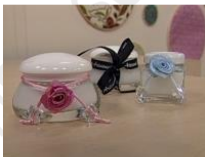
Máscara de Argila

Mesma fórmula do creme hidratante Ferver 2, dissolver 3 e 4 e acrescentar 1 até dissolver, deixar esfriar e colocar 5 e 6.