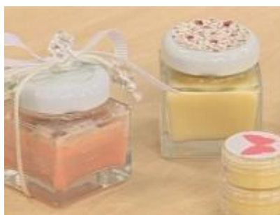
Perfume em Pasta/Sólido

Deixe macerar por no MÍNIMO 10 dias com resfriamento alternado (1 dia no congelador ou freezer e outro dia fora, à temperatura ambiente). Evitar exposição do produto à luz solar.